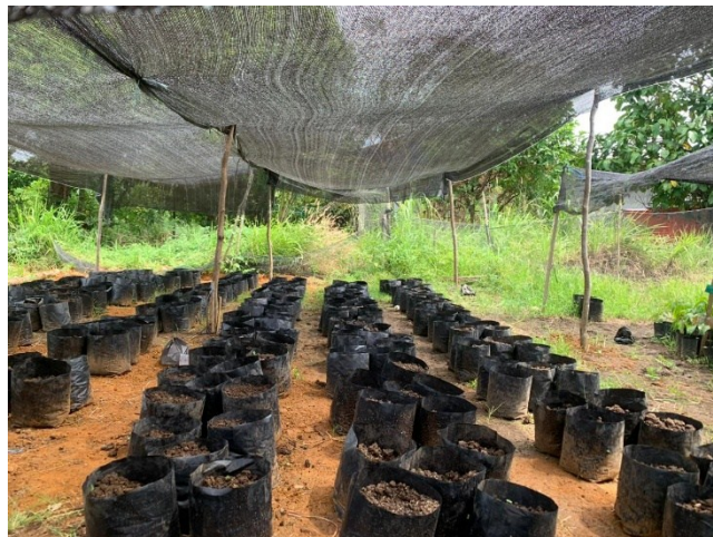
Persiapan media tanam