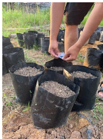
Pengaplikasian pupuk npk