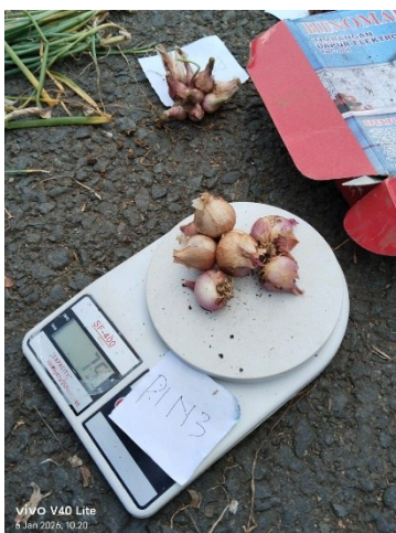
Penimbangan berat basah tanpa daun