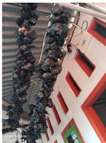
pengering angin anginkan hasil panen