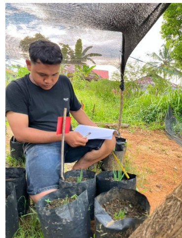
Pengamatan jumlah daun