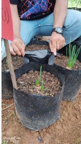
Pengamatan jumlah anakan