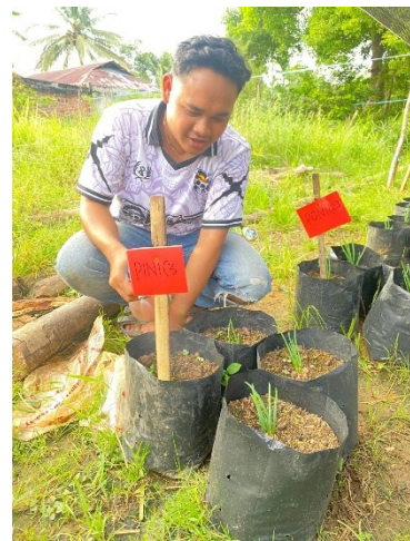
Pengaplikasian poc kulit batang pisang