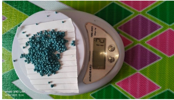
Penimbangan pupuk npk