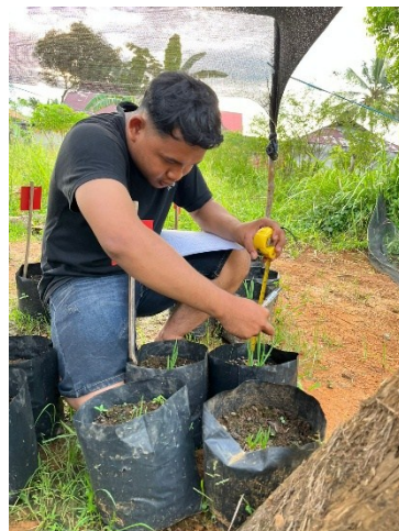
Pengamatan tinggi tanaman