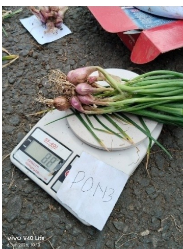
Penimbangan berat bash dengan daun