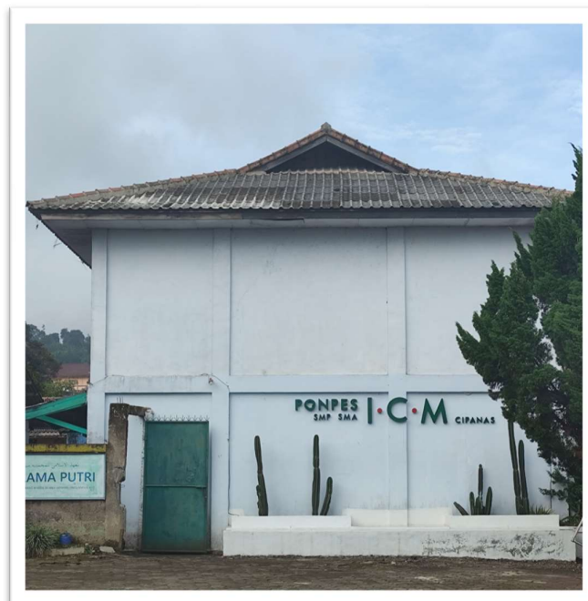
Data : Kondisi Asrama Putri Islamic Centre Muhammadiyah Cipanas