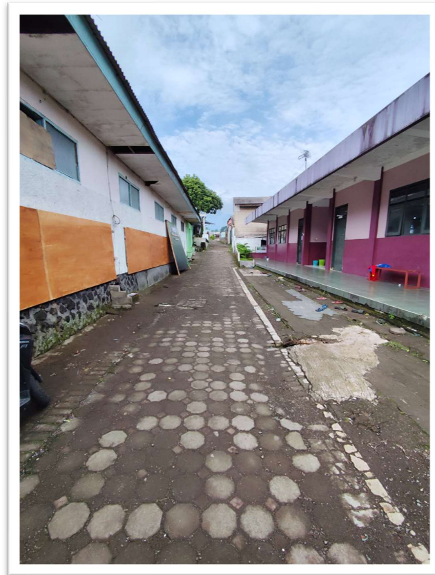
Data : Kondisi Asrama Putra Islamic Centre Muhammadiyah Cipanas