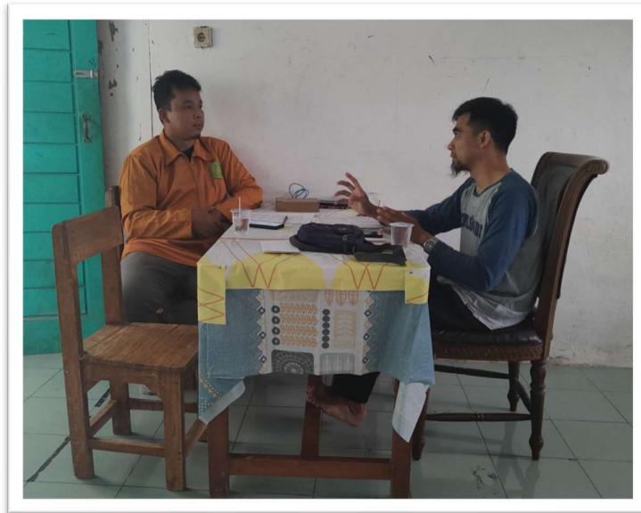
Foto : Wawancara Bersama Pengasuh Asrama Islamic Centre Muhammadiyah Cipanas