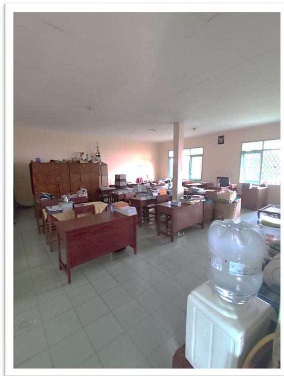
Foto : Ruang Guru di Islamic Centre Muhammadiyah Cipanas