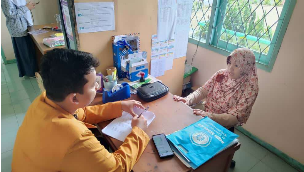
Foto : Mewawancara perwakilan Guru SMP dan SMA Islamic Centre Muhammadiyah Cipanas