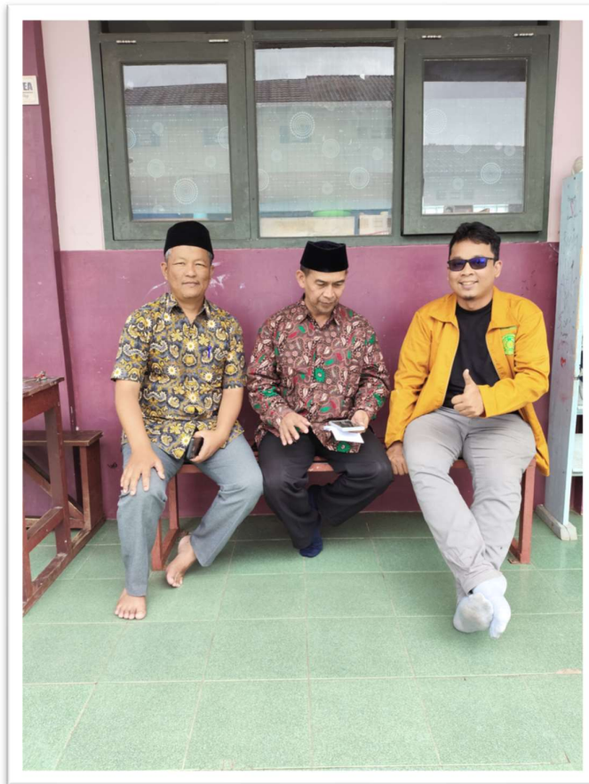
Foto : Bersama setelah wawancara dengan Kepala Sekolah SMP dan SMA Islamic Centre Muhammadiyah Cipanas