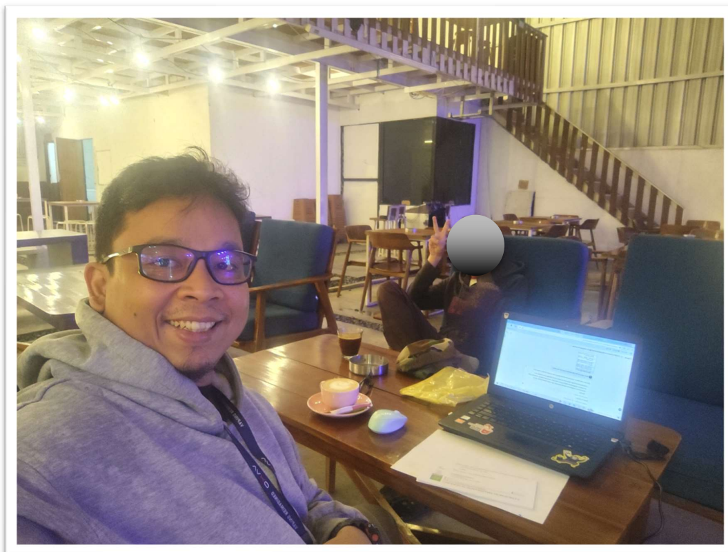
Data : Interview Bersama Wali Santri Islamic Centre Muhammadiyah Cipanas