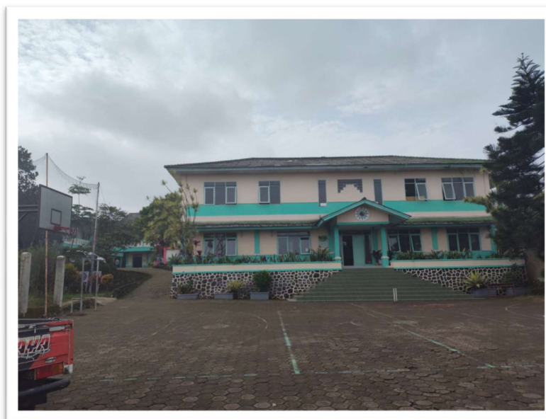
Data : Gedung SMA dan SMP Islamic Centre Muhammadiyah Cipanas