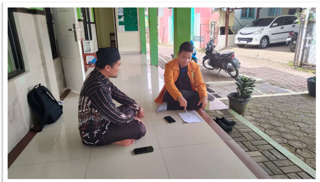
Foto : Wawancara Bersama Mudir Islamic Centre Muhammadiyah Cipanas