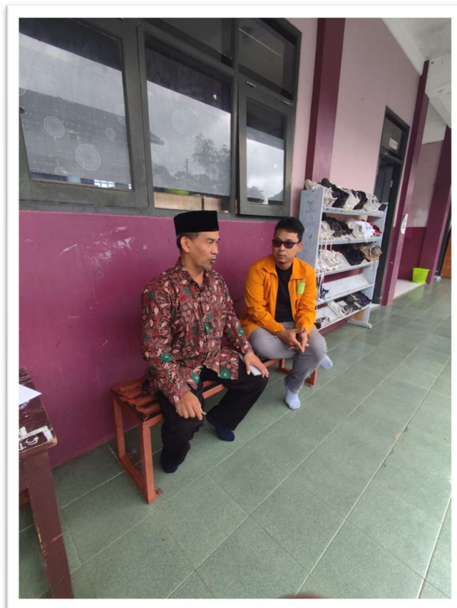
Foto : Mewawancarai Kepala Sekolah SMA Islamic Centre Muhammadiyah Cipanas