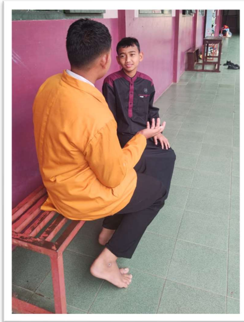
Foto : Mewawancarai Perwakilan Santri ICM