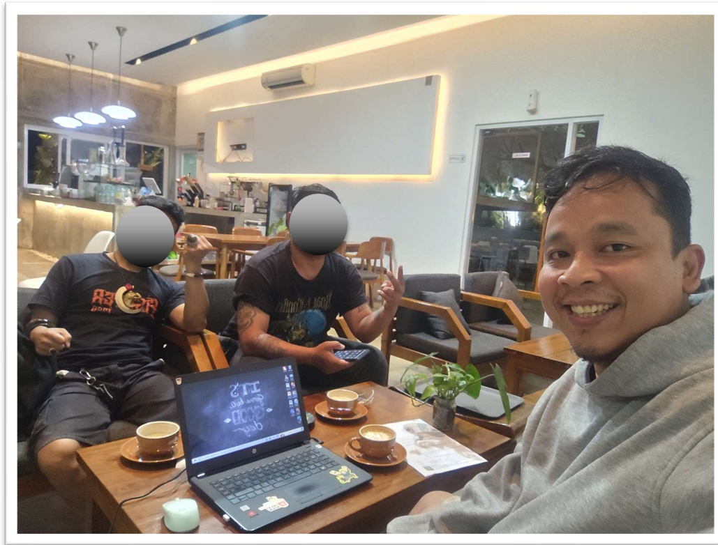
Data : Interview Bersama Alumni Islamic Centre Cipanas