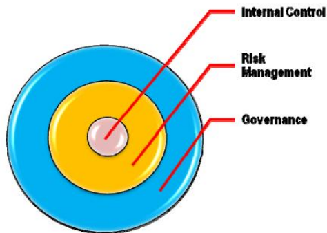
Gambar 5.1. Hubungan antara SPI dan Manajemen Risiko

Keterkaitan antara SPI dan manajemen risiko akan memengaruhi secara keseluruhan dari tatakelola. Hubungan antara SPI dan manajemen risiko ditunjukkan di Gambar 1.