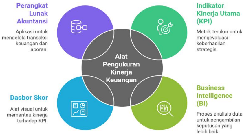
Gambar 11.1 Alat Pengukuran Kinerja Keuangan

Pengukuran kinerja keuangan tidak lagi hanya mengandalkan laporan keuangan konvensional, melainkan juga didukung oleh perangkat digital, visualisasi data, dan analisis prediktif yang semakin canggih.