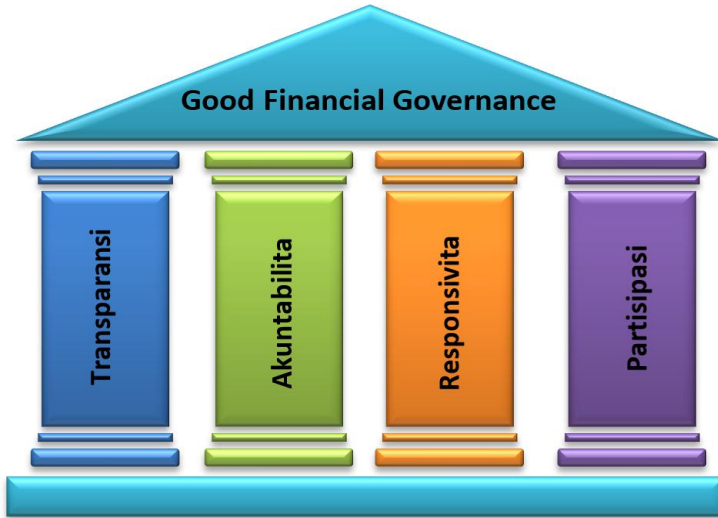
Gambar 2. Pilar Utama Good Financial Governance