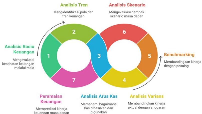
Gambar 11.2 Teknik Pengukuran Kinerja Keuangan