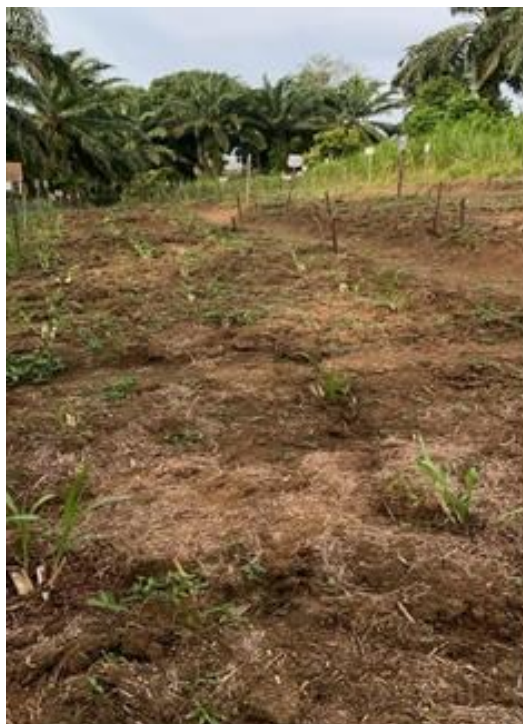
Gambar 5. Penanaman rumput pakchong