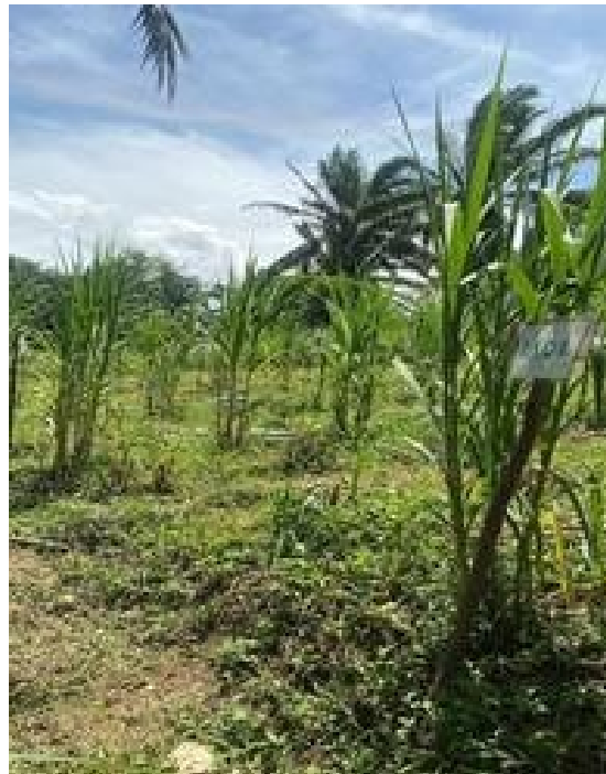
Gambar 6. Rumput Pakchong siap panen