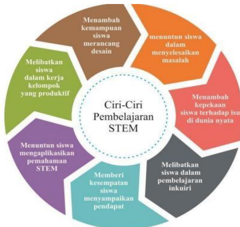
Gambar 2.1. Ciri-ciri Pembelajaran STEM

Pelaksanaan pembelajaran STEM pendidik harus dapat mengintegrasikan pengetahuan, ketrampilan dan nilai ilmu pengetahuan, teknologi, rekayasa, dan matematika untuk dapat menyelesaikan sebuah masalah yang berhubungan dengan pembelajaran dalam konteks kehidupan sehari-hari. Ciri-ciri pembelajaran STEM dijabarkan pada Gambar 2.1.