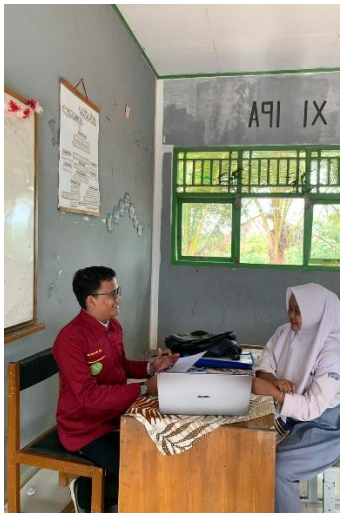
Dokumentasi Uji Kepratisan Siswa