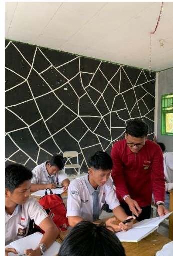
Dokumentasi Uji Kepratisan Siswa