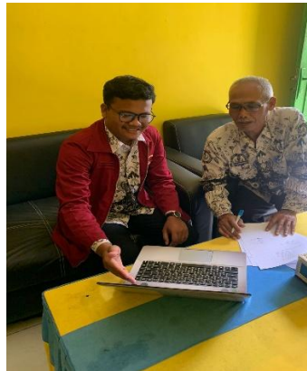
Dokumentasi Proses Validasi Ahli 2