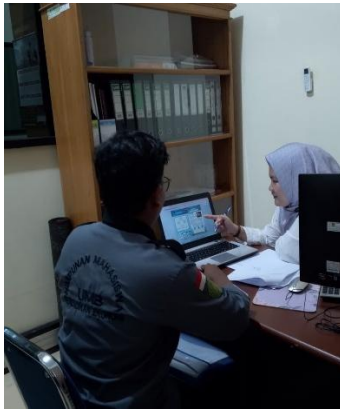
Dokumentasi Proses Validasi Ahli 1