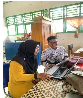
Dokumentasi Proses Uji Kepratisan Guru