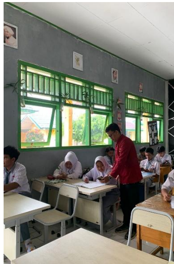
Dokumentasi Uji Kepratisan Siswa