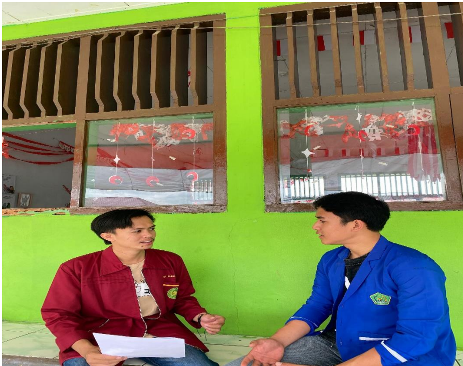
gambar 1.2 7 Wawancara bersama ketua RPDI