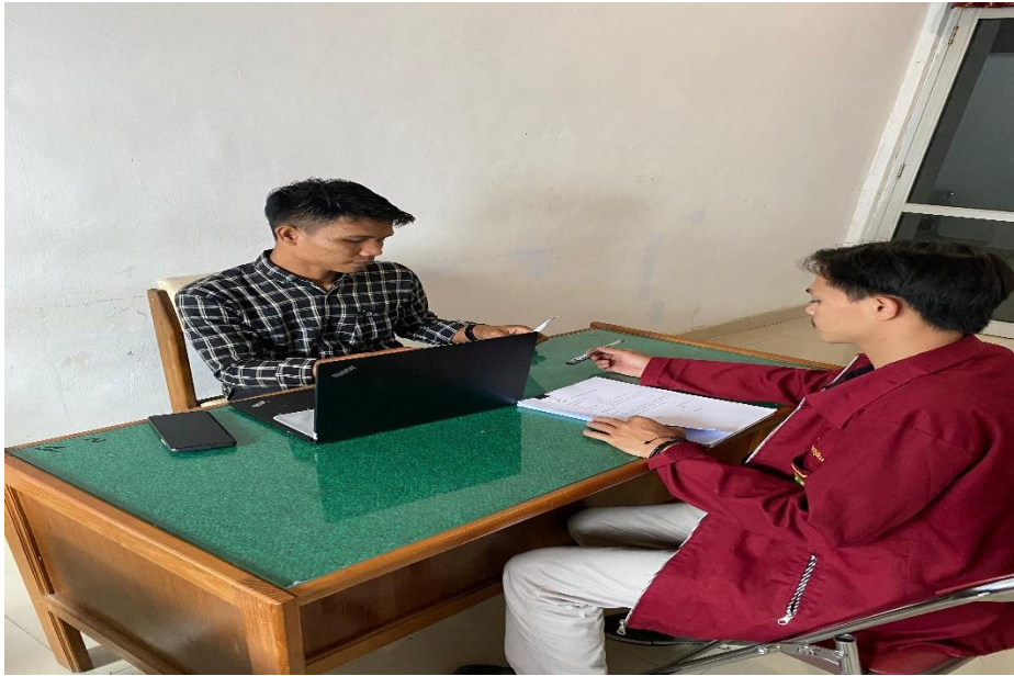
gambar 1.2 6 wawancara bersama pembina RPDI