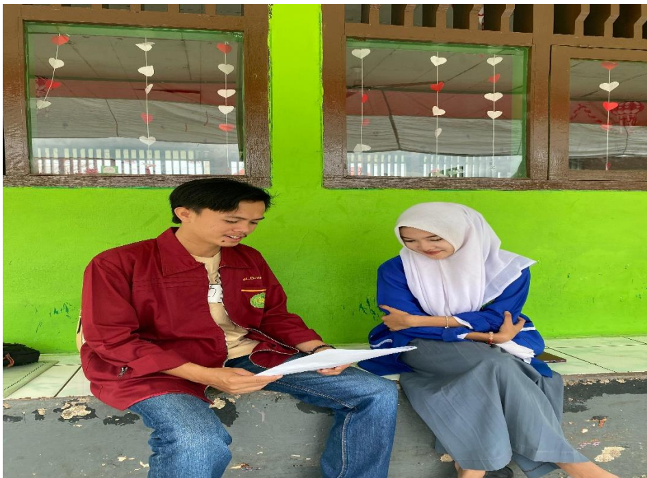
gambar 1.2 9 Wawancara bersama siswi man 02 kepahiang