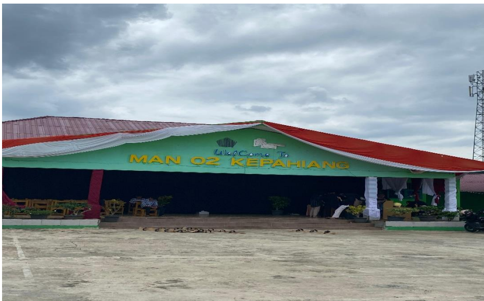
gambar 1.1 2 lapangan sekolah