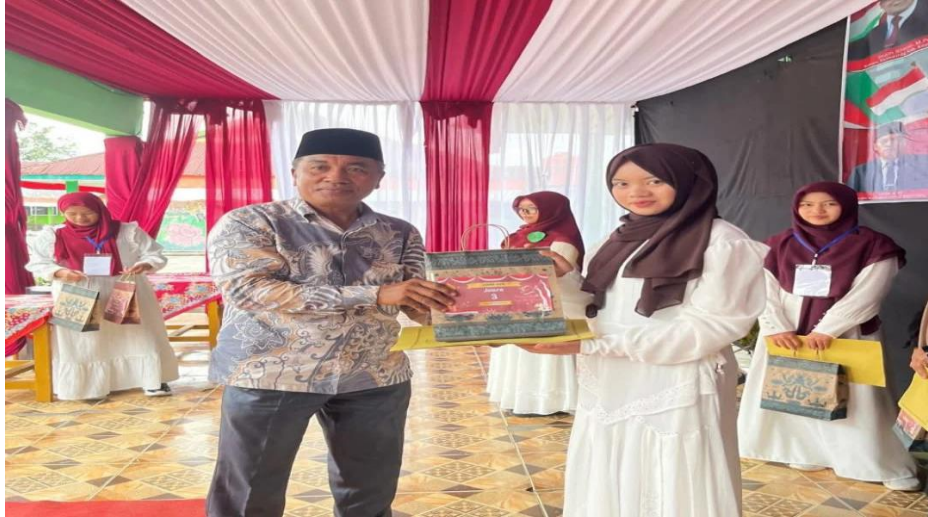
gambar 1.1 3 kegiatan remaja peduli dakwah islam