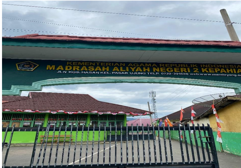
gambar 1.1 1 gerbang man 02