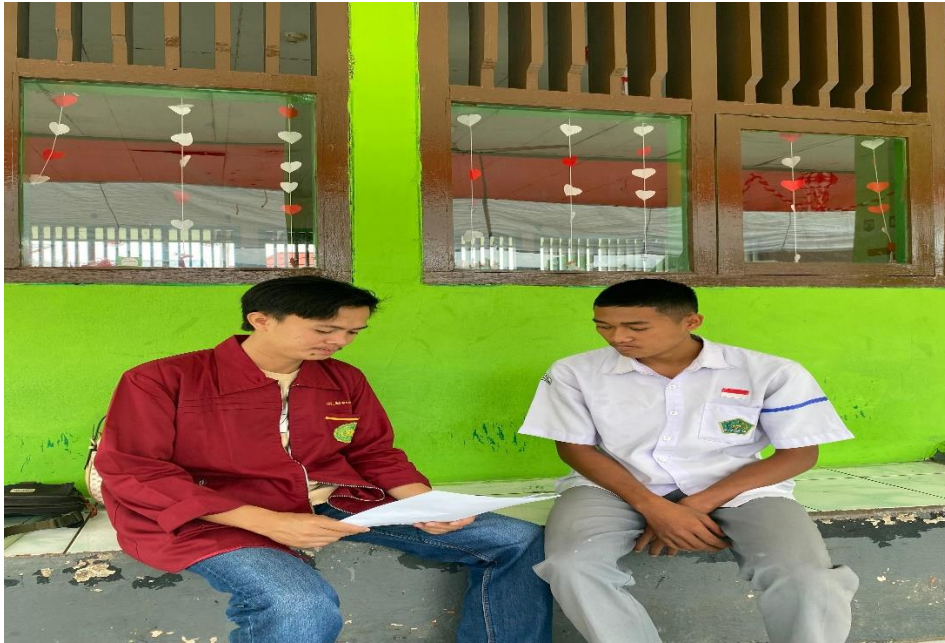
gambar 1.2 8 Wawancara bersama siswa man 02 kepahiang