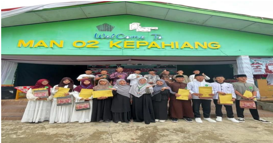
gambar 1.1 4 kegiatan remaja peduli dakwah islam