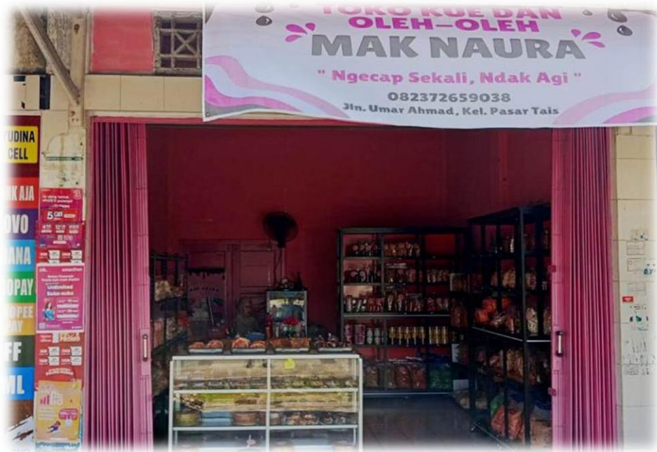
FOTO TOKO KUE DAN OLEH-OLEH MAK NAURA