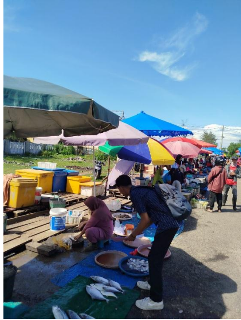
Foto 2. Dokumentasi dengan pedagang ikan