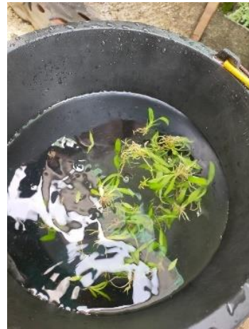
Pengeluran Anggrek dalam Botol