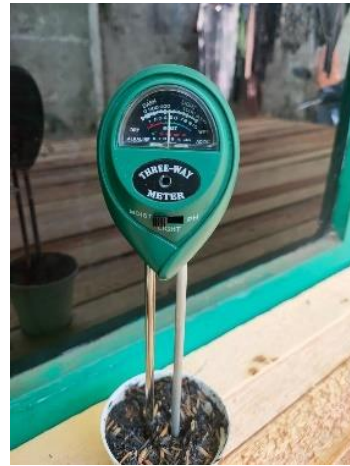
pH Media Tanam