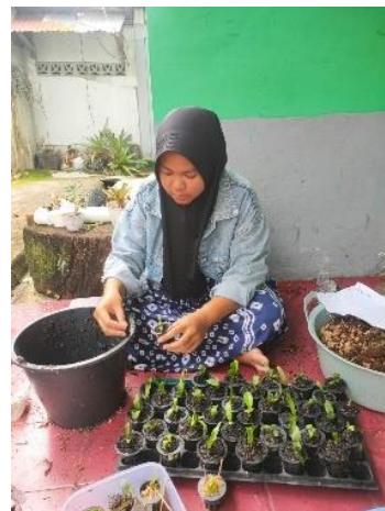
Pemindahan Media Tanam