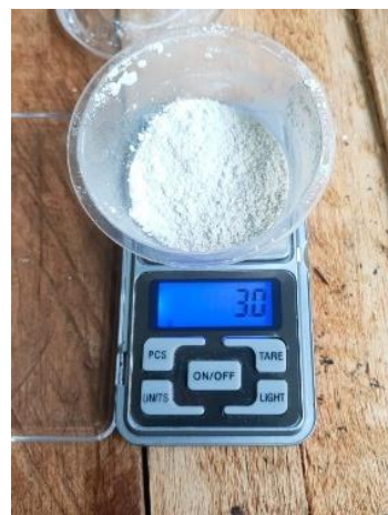
Pembersihan Akar Anggrek dan Pemberian Fungisida