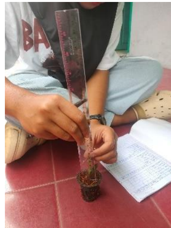
Pengukuran Tinggi Tanaman