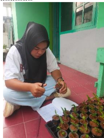
Pengukuran Lebar Daun