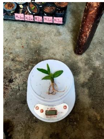
Pengukuran Berat Basah