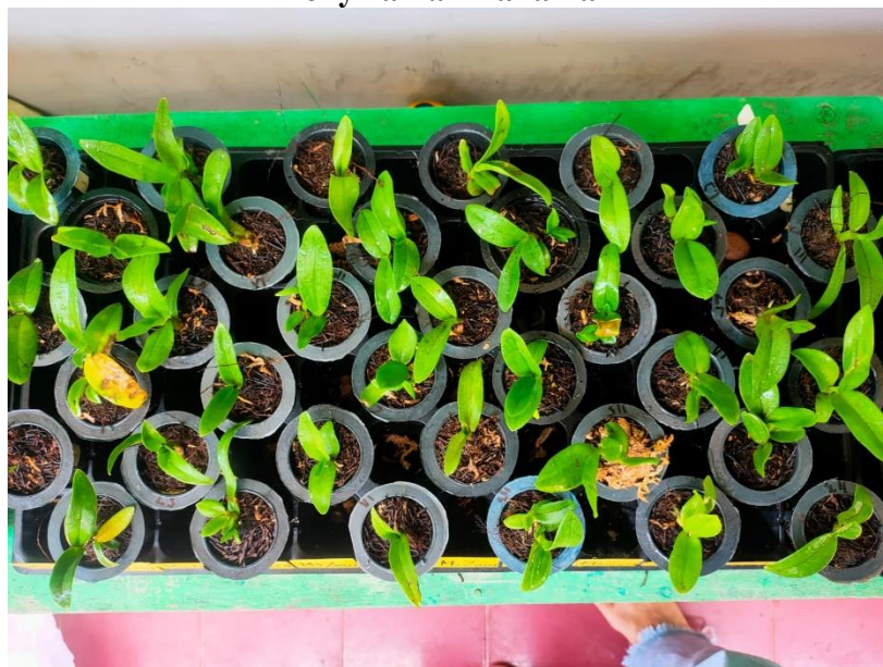
Tanaman Anggrek Dendrobium