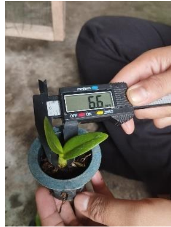
Pengukuran Diameter Batang